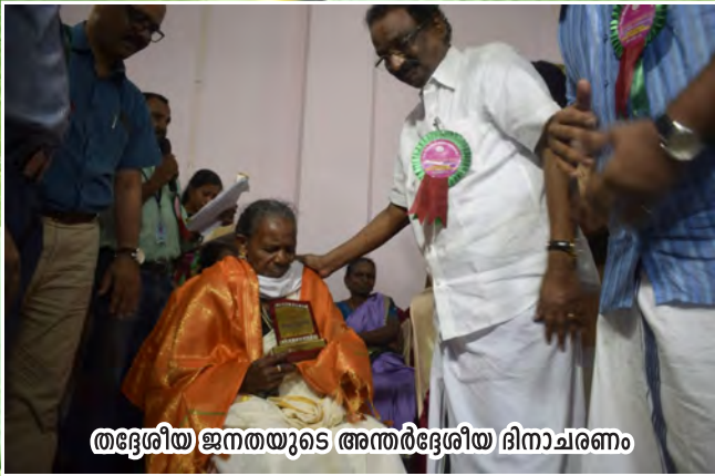
തദ്ദേശീയ ജനതയുടെ അന്തർദ്ദേശീയ ദിനാചരണം