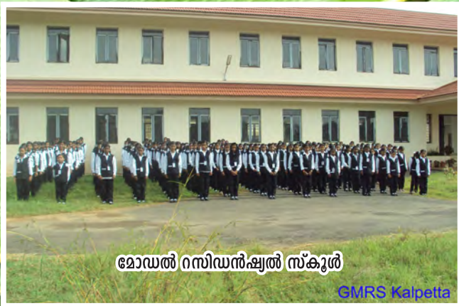
മോഡൽ റസിഡൻഷ്യൽ സ്കൂൾ