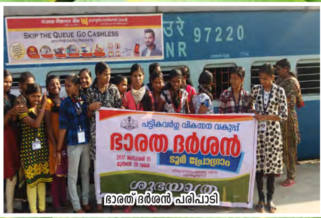
ഭാരത ഭർശൻ പരിപാടി